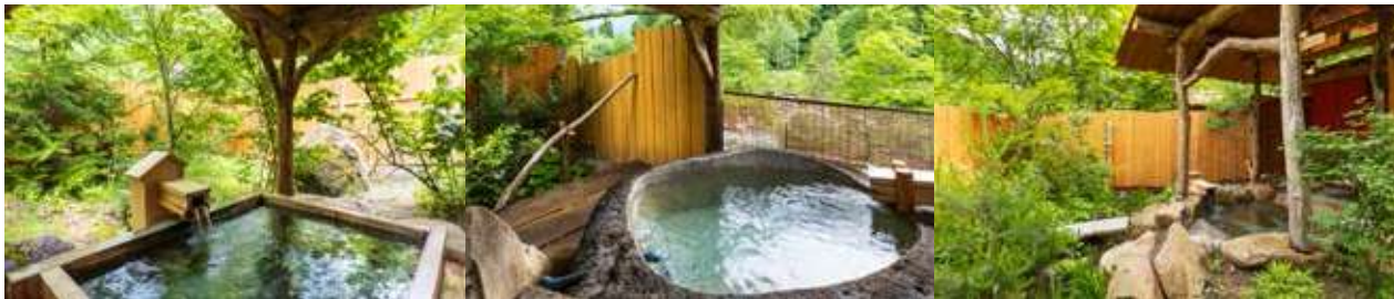
雫の湯 五所五感の野天風呂