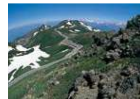
乗鞍スカイライン