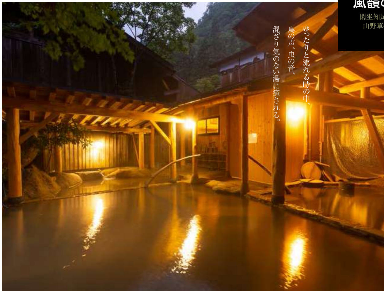
心穏やかに自然の響きを感じる閑坐の湯