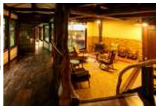
湯上がりお休み処