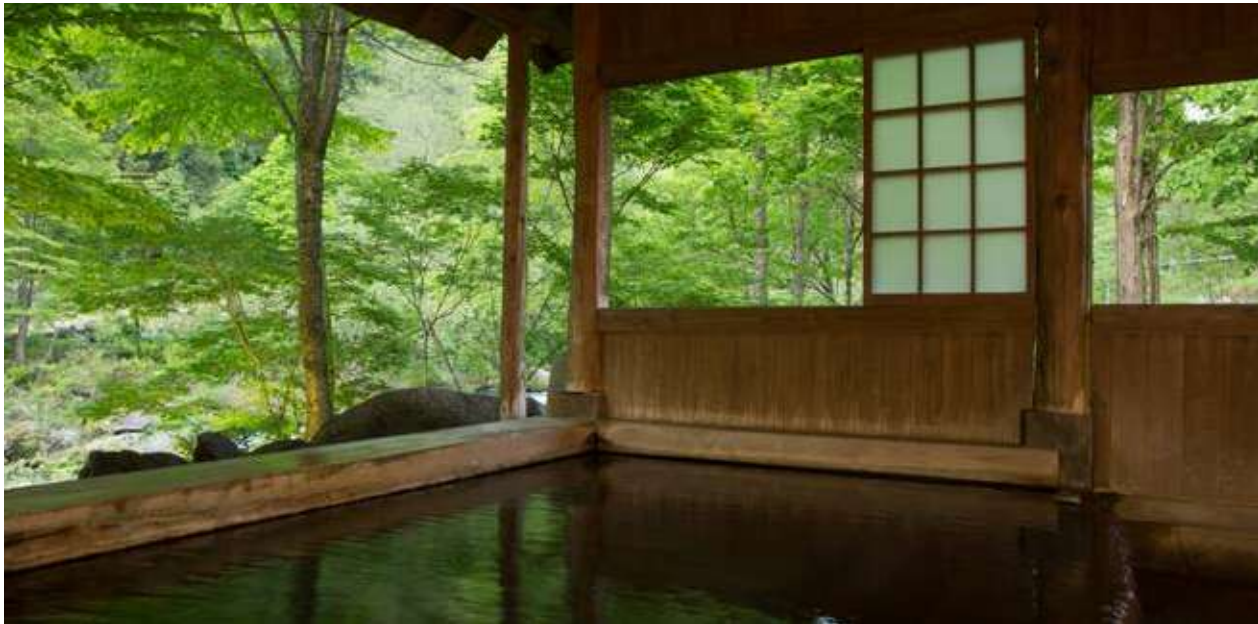
四季に移ろう自然と川面を望む半露天風呂(かわらの湯)